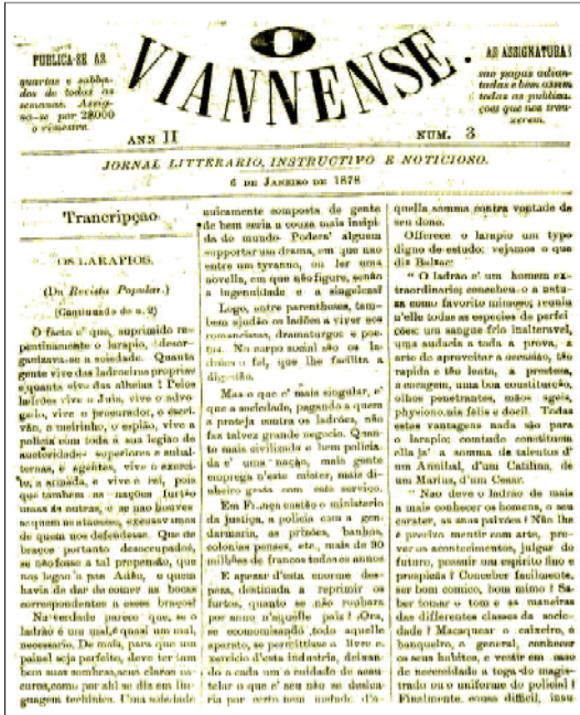
Capa do jornal O Vianense, datado de 6 de janeiro de 1878

Voltados para uma população com altíssimo índice de analfabetismo (onde mais de 70% da mão-de-obra era formada por escravos), os jornais se alternavam na tentativa persistente e inglória de firma-se no cenário cultural da cidade. Em 1880 foi a vez de A Reforma , jornal que se declarava "literário, noticioso e comercial". De propriedade do jornalista Tancredo