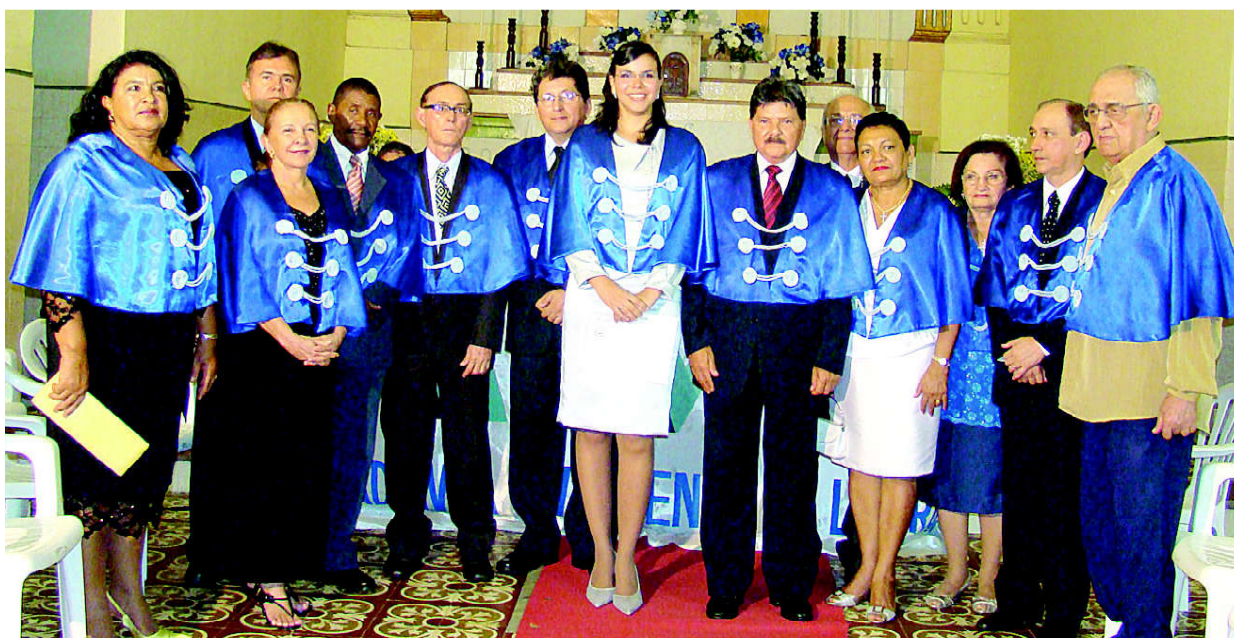
Foto oficial: a mais jovem acadêmica da AVL cercada pelos seus confrades.

composições: o animado xote “Redinha de Algodão” e a emotiva valsa “Saudades do Maranhão.”