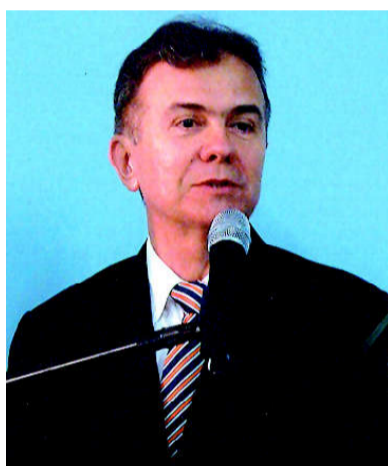
O presidente da AVL fazendo seu pronunciamento na Câmara Municipal de Viana