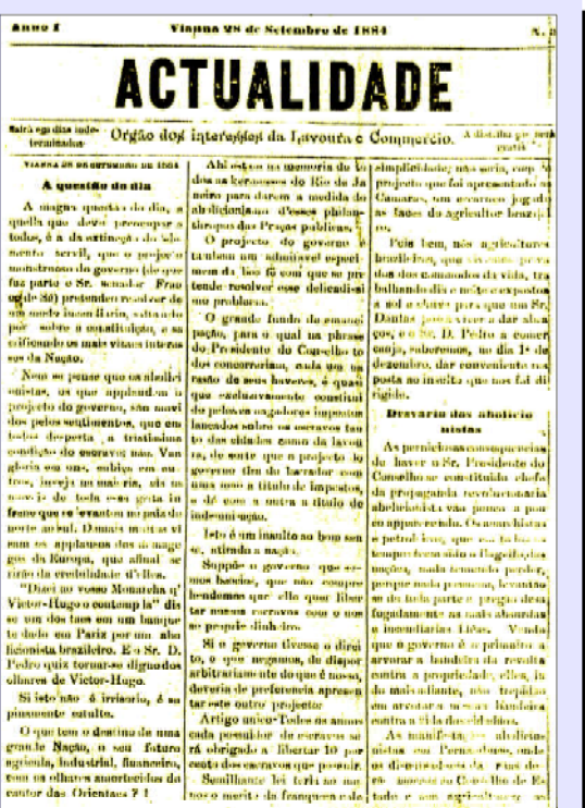
A Reforma e Actualidade: dois periódicos que pontificaram na Viana do século XIX