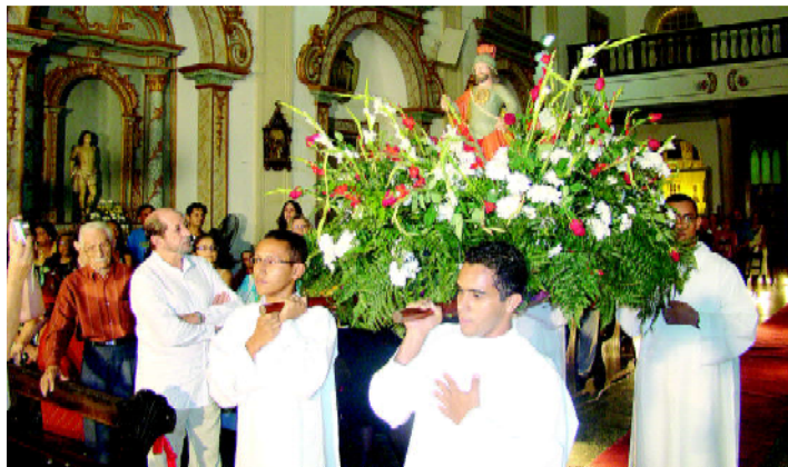
Quatro seminaristas conduziram o andor de São Bonifácio