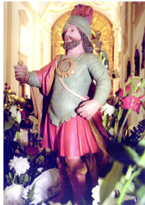
A imagem restaurada de São Bonifácio