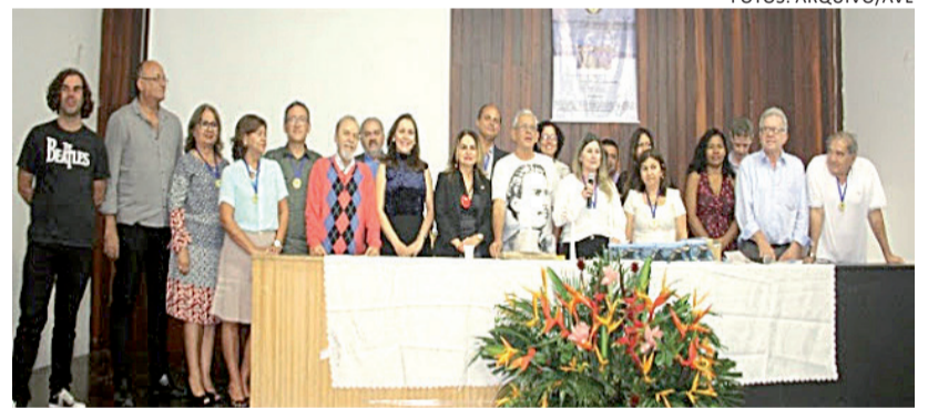
AVL presente no IV Encontro Nacional da SCLB

Além da comenda e do lançamento da coletânea, o evento contou ainda com a realização de palestras, mesas redondas de comunicações temáticas, comunicações de temas livres, apresentação de poesias e de contos; reuniões da Diretoria da SCLB, lançamento coletivo de livros, com destaque para o