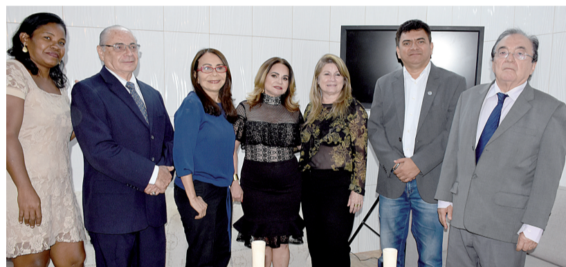
Acadêmicos de diversas academias do Maranhão