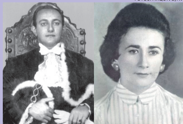
Galeria dos patronos