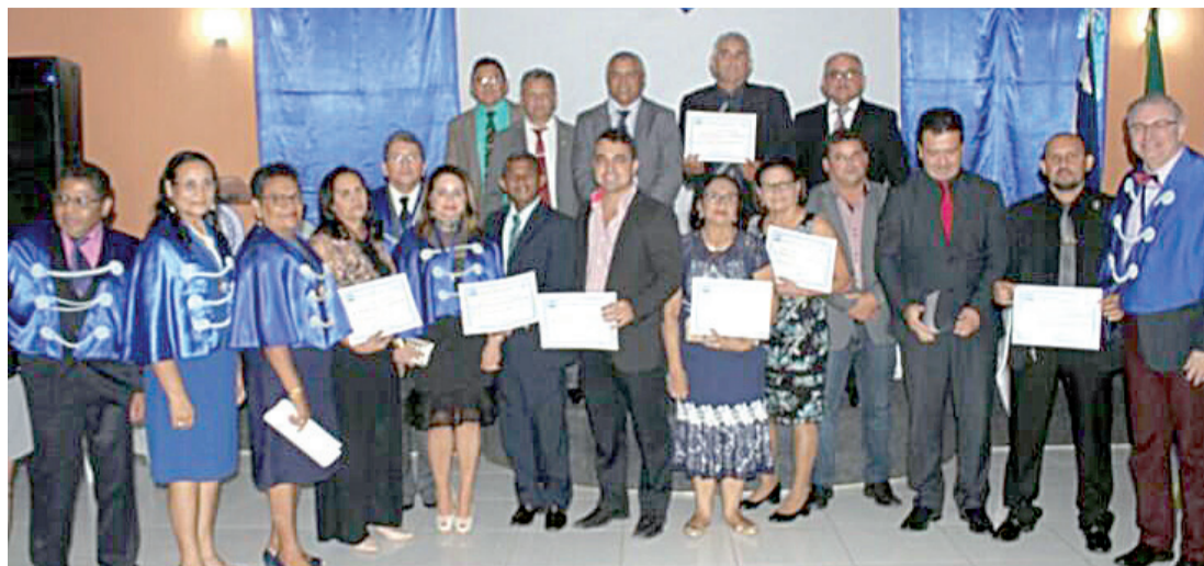
Homenageados e Acadêmicos da AVL