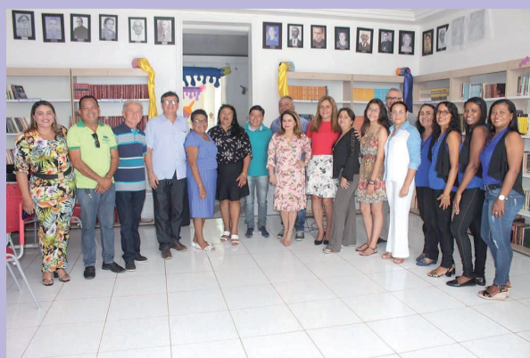
Acadêmicos e familiares