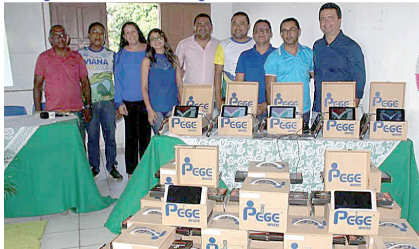
Entrega dos kits escolar digital – Gestores