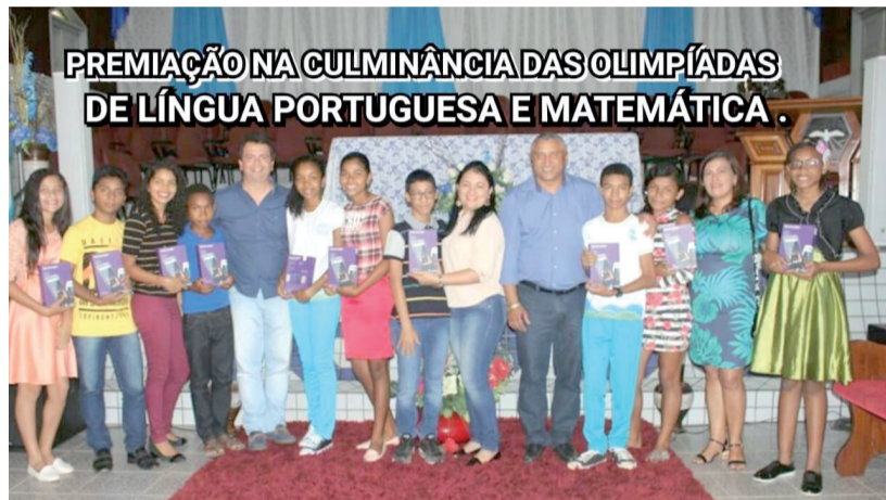
PREMIAÇÃO NA CULMINÂNCIA DAS OLIMPÍADAS DE LÍNGUA PORTUGUESA E MATEMÁTICA.