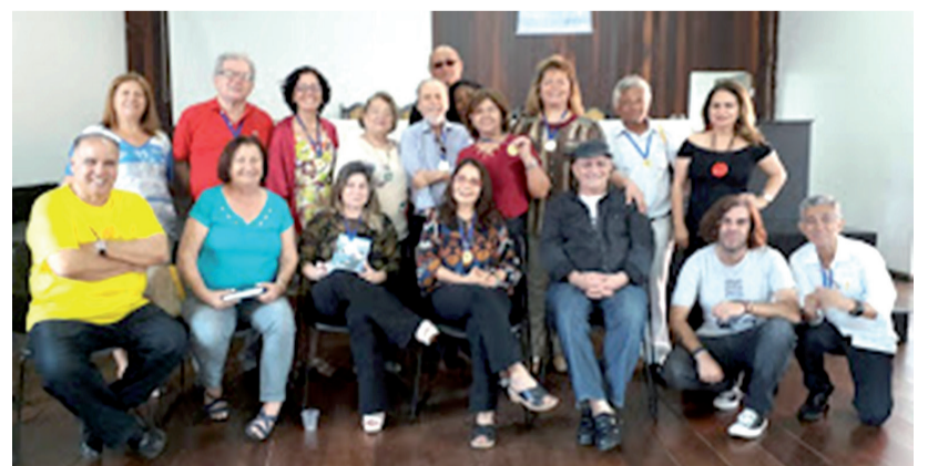
Acadêmicos homenageados pela SCLB