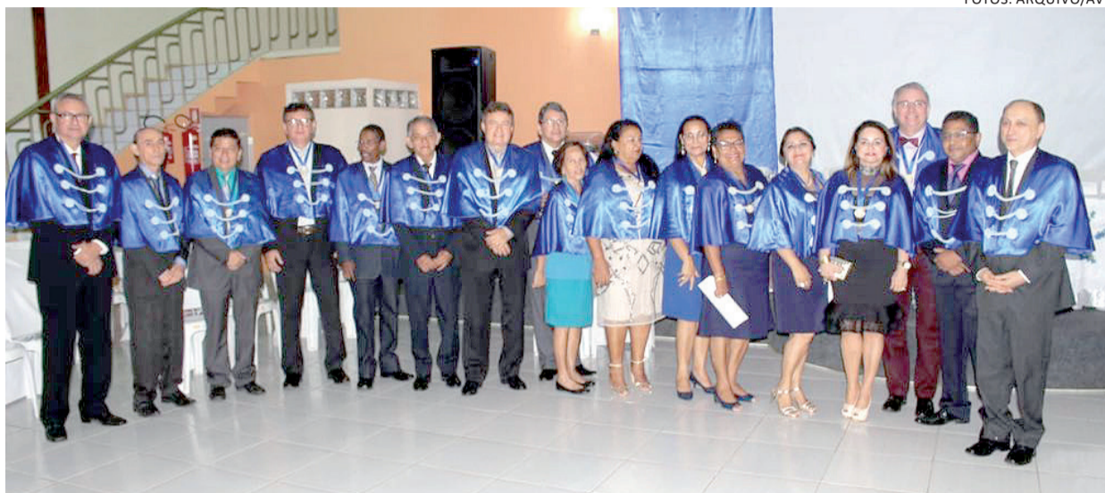
Acadêmicos da AVL e novos membros

Também foi empossada, como membro efetivo, a acadêmica