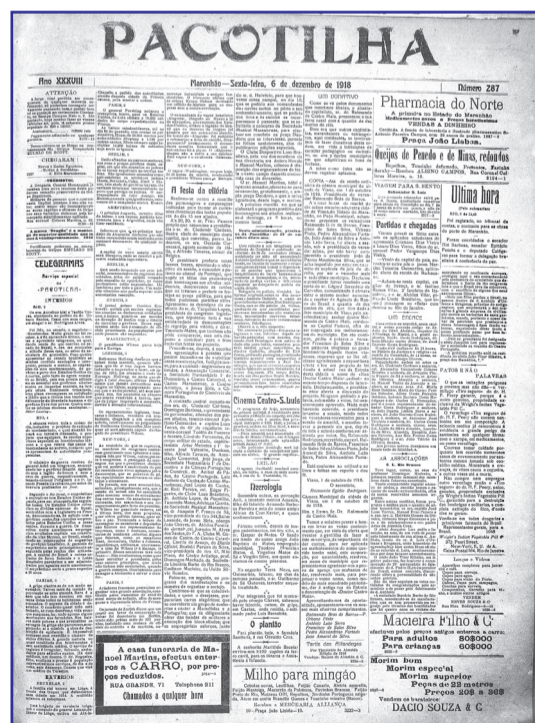
UM DONATIVOVO. Pacotilha (MA), 6 dez. 1918. p. 1